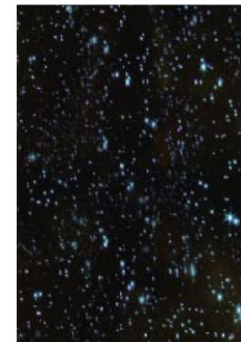
CS 2041 Black